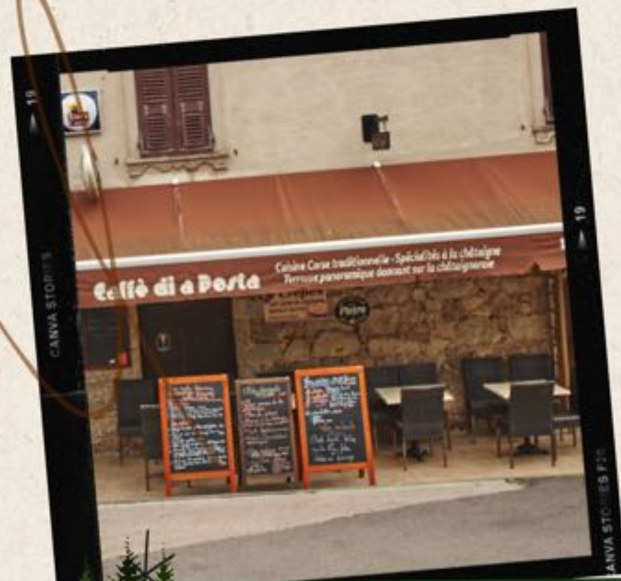
Campemuci in Evisa

Les restaurateurs d'Evisa vous accueillent le samedi 2 midi et soir et le dimanche 3 décembre midi (et soir)