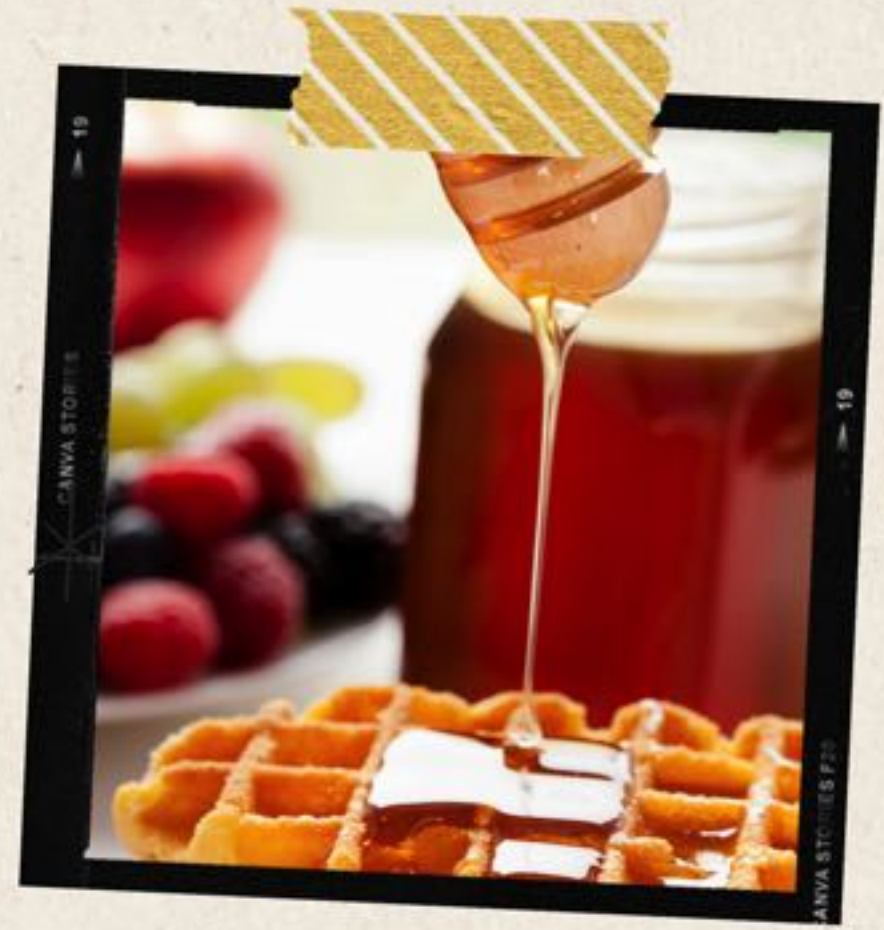
gaufres et crêpes