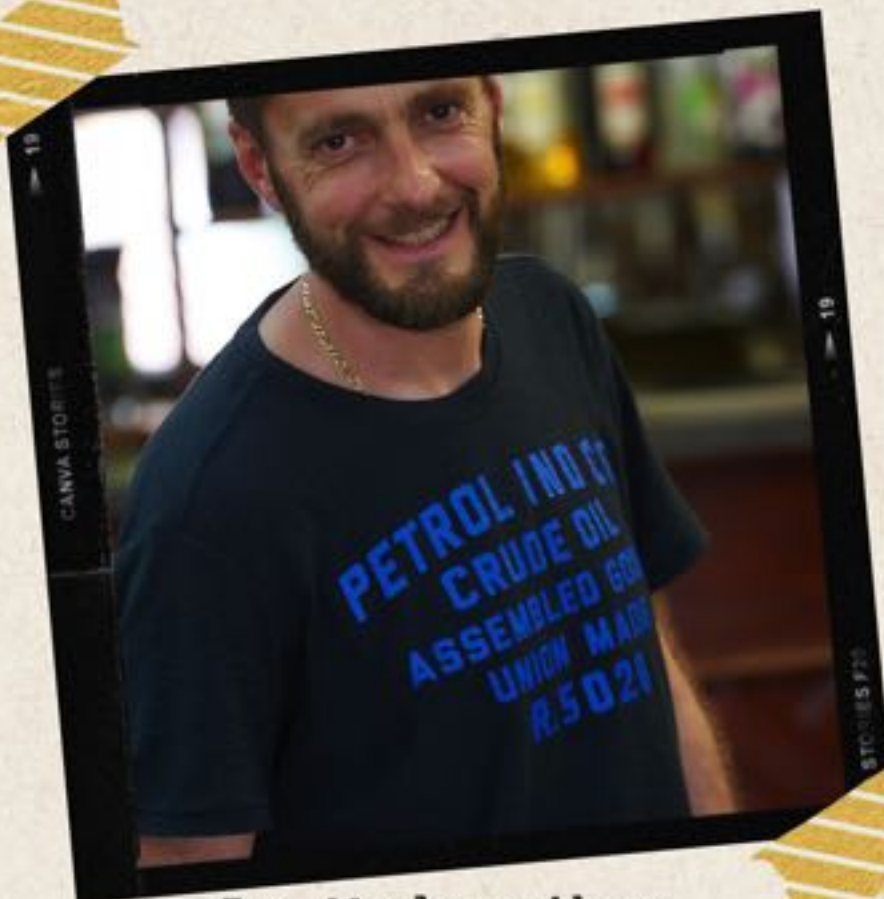
Le Modern'bar 04 95 26 21 72