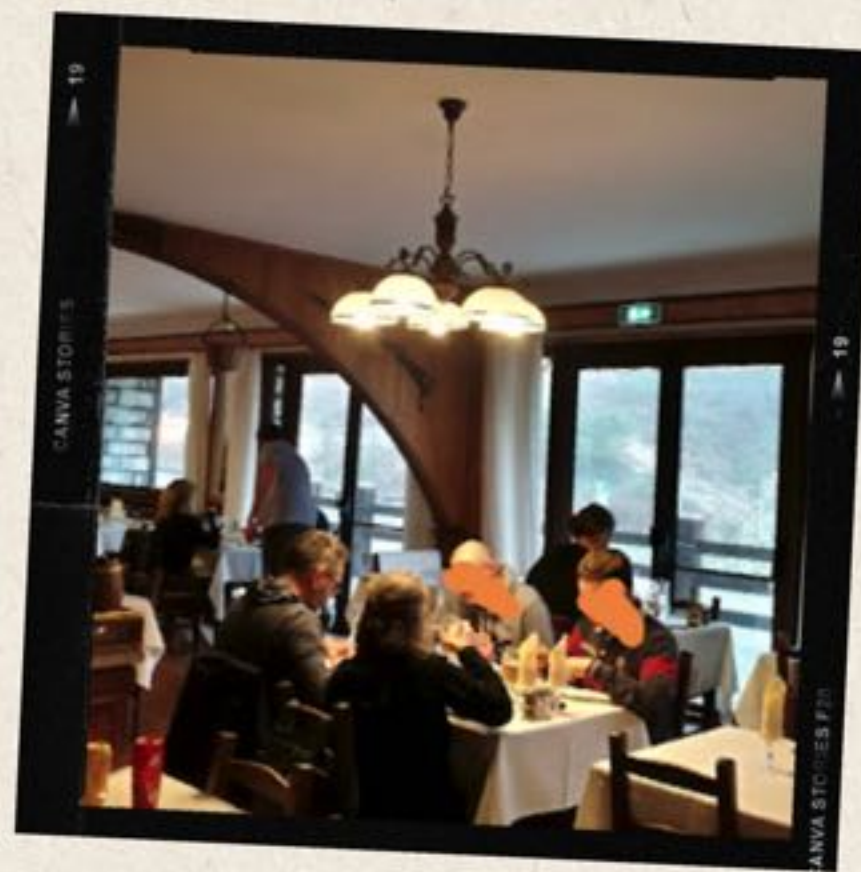
Scopa Rossa 04 95 26 20 22