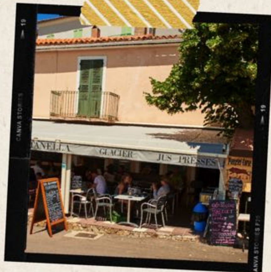
A Funtanella 04 95 26 47 31 06 15 24 39 75