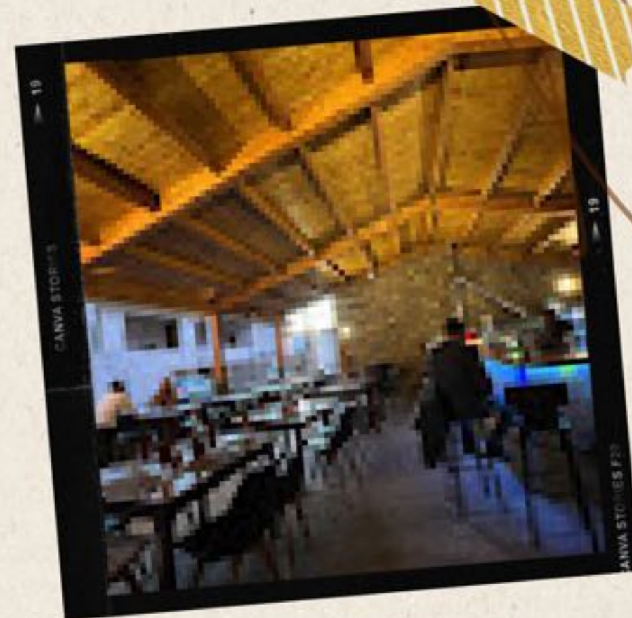
U Caracutu 04 95 73 53 24